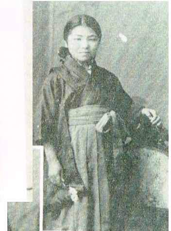
私達は誰でしょう? (答えは最終頁)