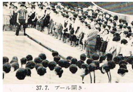
37. 7. プール開き