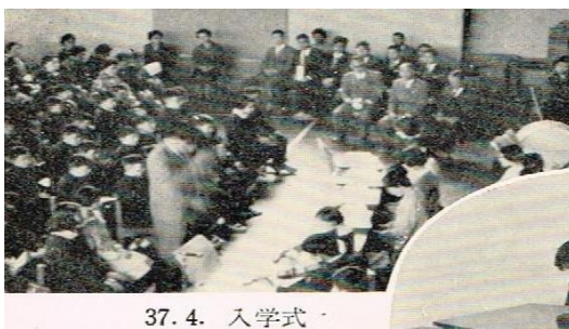
37. 4. 入学式